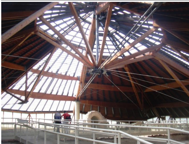
Große Therme, Zeldachkonstruktion